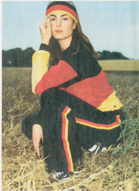
Entwürfe aus der aktuellen Kollektion der Kölner Modemacherin Eva Gronbach