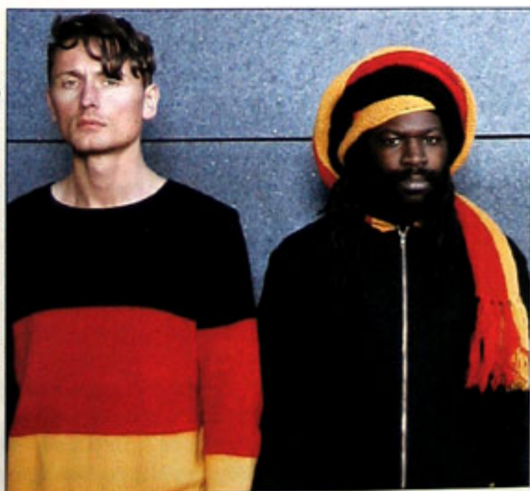
Eva Gronbachs Herbst/Winter-Kollektion 2004/2005 „Meine neue deutsche Polizeiuniform“